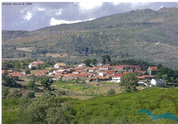
Requalificação das Aldeias