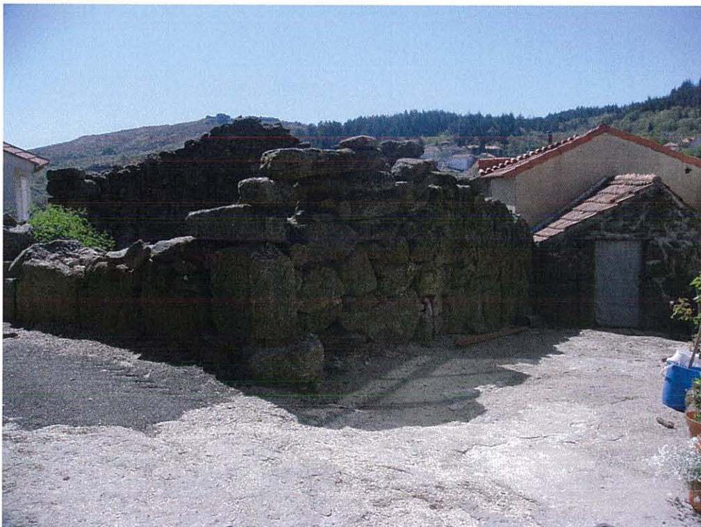
Foto 2- Vista do exterior do edificado