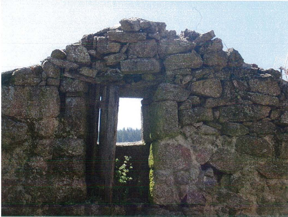
Foto 3- Vista de pormenor do outão em perigo iminente de derrocada