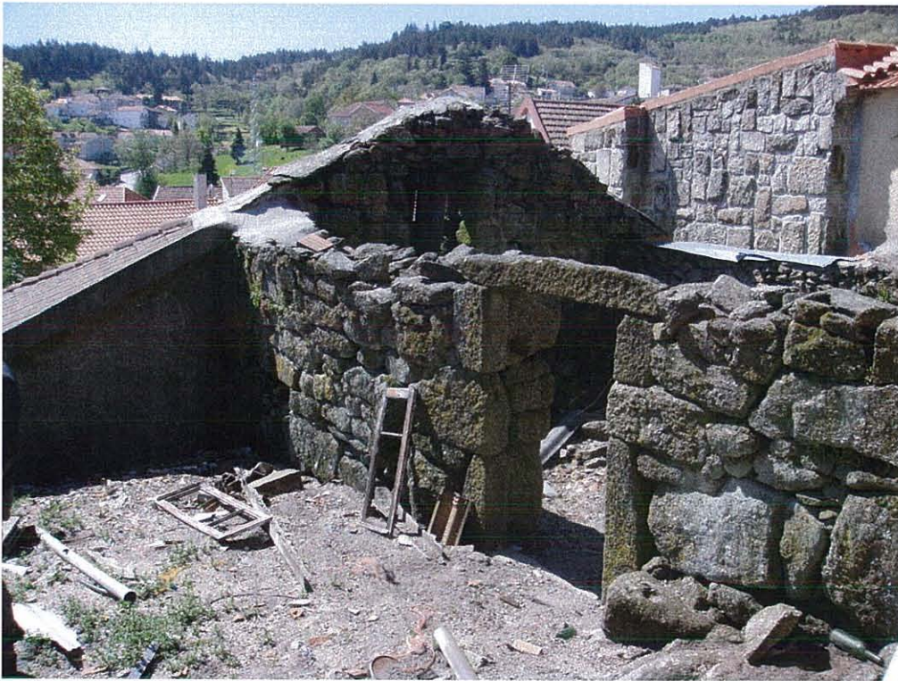
Foto 1- Vista do interior do edificado