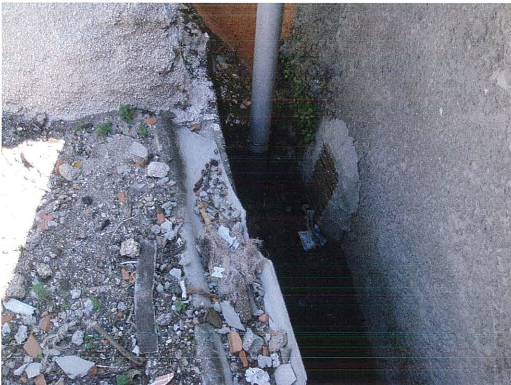
Foto 4- Vista de pormenor do sistema de escoamento de águas pluviais do(s) prédio(s)