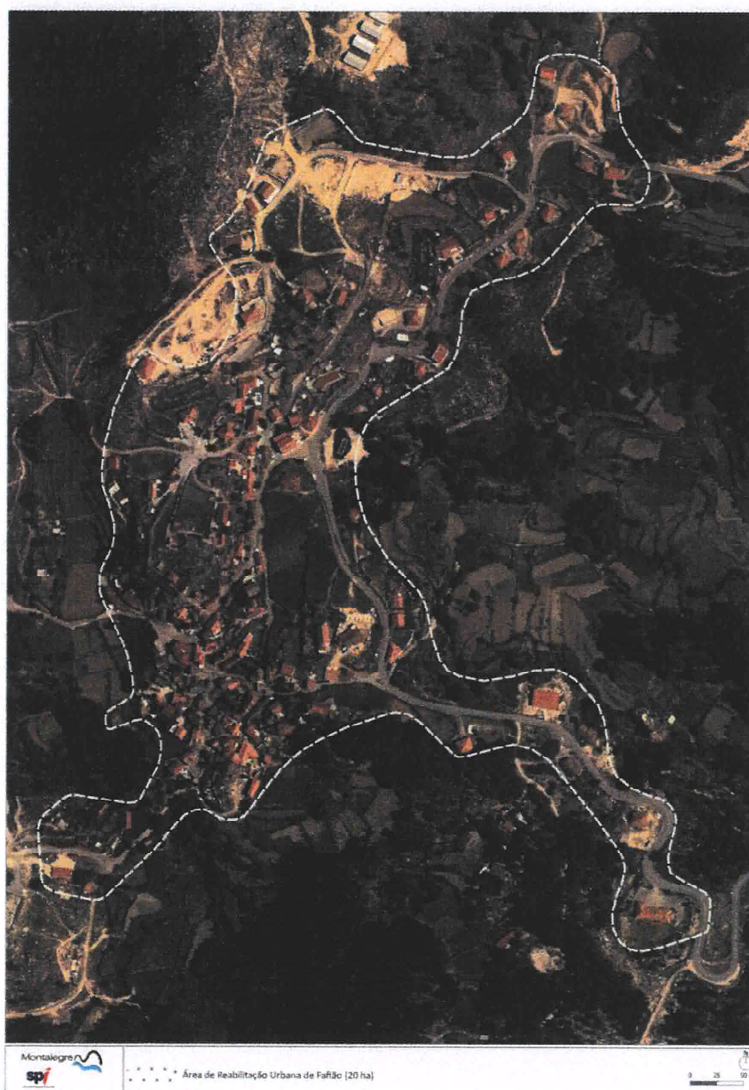
Figura 3. Delimitação da ARU de Fafião sobre ortofotomapa da Direção-Geral do Território

A proposta de delimitação da ARU de Fafião incide em 20 hectares do território da freguesia. A delimitação apresentada tem por base as áreas consolidadas consideradas na revisão do PDM de Montalegre, compreendendo, não apenas áreas com problemas de degradação ou obsolescência dos edifícios, mas também os principais equipamentos de uso coletivo e elementos patrimoniais relevantes, bem como espaços públicos com necessidades de qualificação e valorização. Apresentam-se em anexo a planta da ARU sobre o ortofotomapa de 2021.