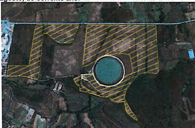
Figura 1 – Área para produção de feno sujeita a hasta pública